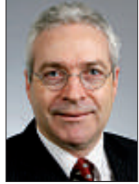
von Jürg Buob, Chefredaktor

Als Netscape den Markt für Internet-Browser zu dominieren begann, verschenkte Microsoft kurzerhand den In-